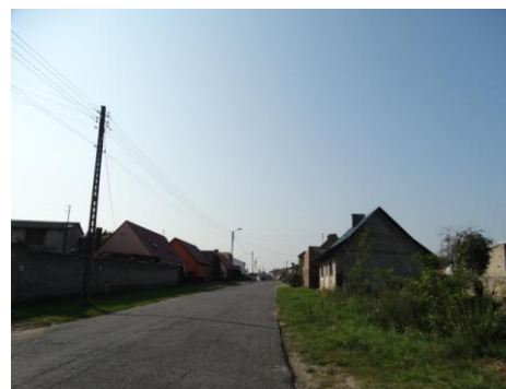
Foto: Centrum wsi Skic