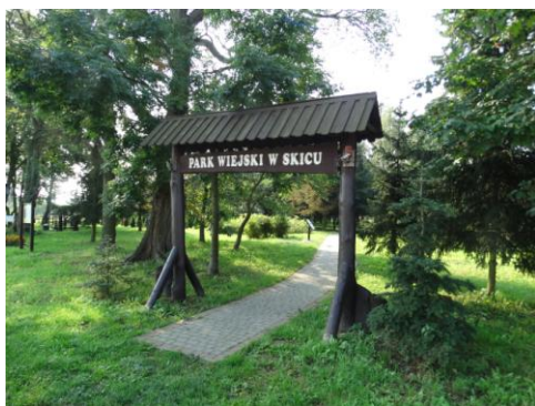
Foto: Park wiejski w Skicu